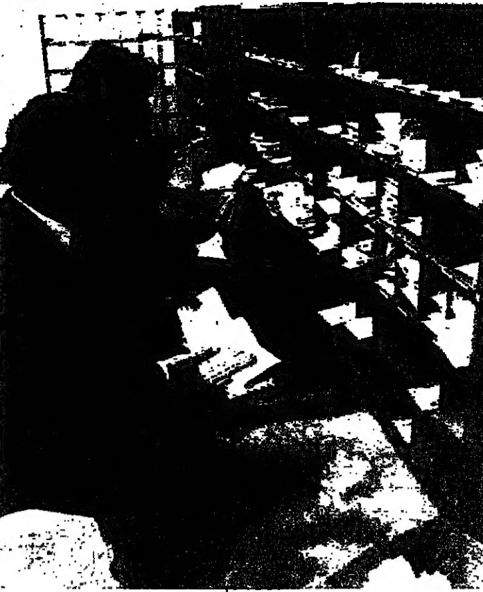
فرز الرسائل في بريد المطار

الأسلوب الجديد أما طريقة عمل هذا المكتب على صعيد استلام الرسائل ، فتتركز على وجوب تسليم الرسالة الواردة من الخارج الى بيروت في اليوم نفسه الذي ترد فيه الى المركز ، أو في اليوم التالي اذا كان صاحبه يقبها في المحافظات .